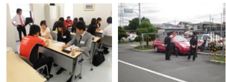
毎年新入社員研修の一環として、特別運転教習訓練を実施しています。