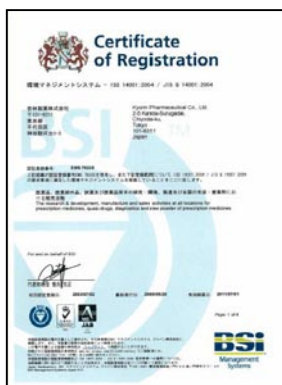
【 ISO14001（環境マネジメントシステム）認証登録証】