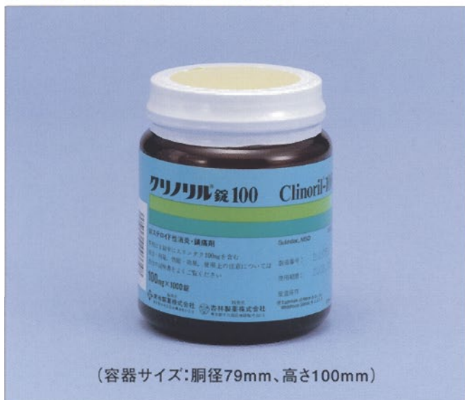
(容器サイズ: 胴径79mm、高さ100mm)