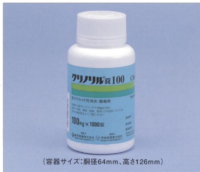
(容器サイズ: 胴径64mm、高さ126mm)